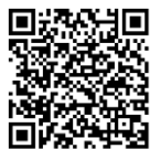
บันทึกการประชุมสภา สำนักrayงาน การประชุมและขอเลข