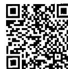
เอกสารประกอบ การพิจารณา สำนักวิชาการ