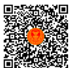
หนังสือนัดประชุม และระเบียบวาระการประชุม สภาผู้แทนราษฎร

เอกสารประกอบการประชุมสภาผู้แทนราษฎร ได้เผยแพร่ทางสื่ออิเล็กทรอนิกส์ ตามข้อบังคับฯ ข้อ ๒๑ วรรคหนึ่ง เรียบร้อยแล้ว โดยท่านสมาชิกฯ สามารถอ่านเอกสารประกอบการประชุมได้ โดยการสแกน QR Code หรือทาง www.parliament.go.th